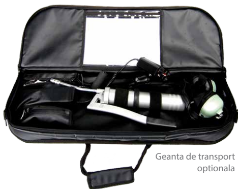
Geanta de transport optionala