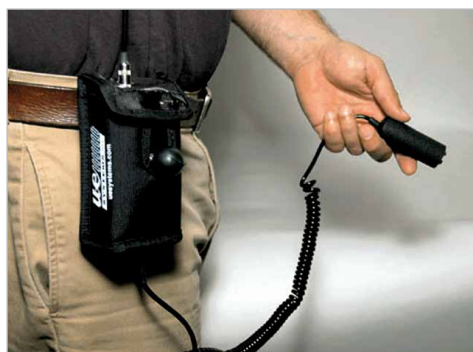
Toc UP-201 pentru cureaua