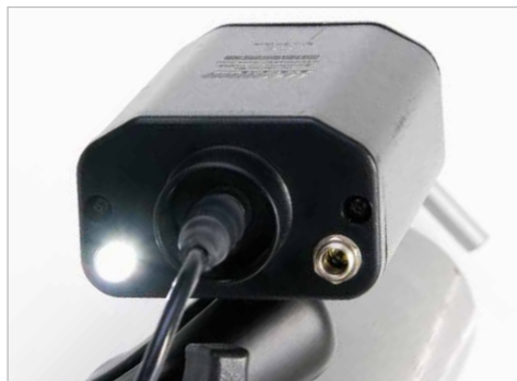
Spot luminos integrat