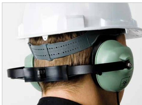
Casti audio pentru utilizare cu casca de protectie