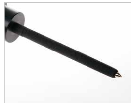
Módulo de Estetoscópio