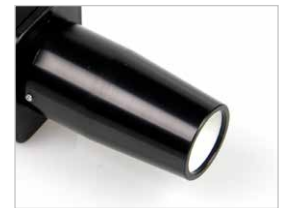
Módulo de Foco Próximo