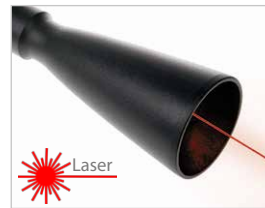
Módulo de Longo Alcance