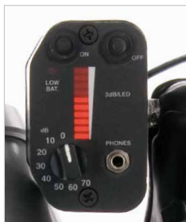
Οθόνη LED και περιστροφικός διακόπτης ευαισθησίας