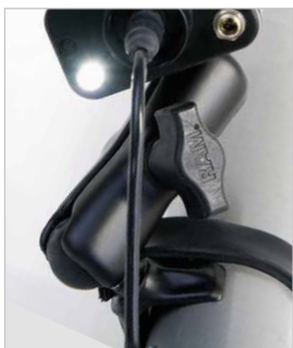
Συμπεριλαμβάνεται ο μηχανισμός συγκράτησης στο πιστόλι γράσου