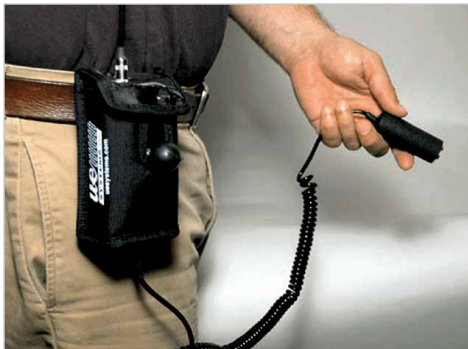
Θήκη για το UP