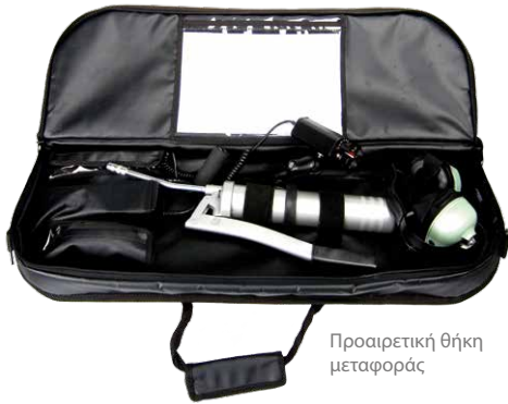
Προαιρετική θήκη μεταφοράς