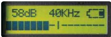
Schaal is in gekalibreerde decibels aantoonbaar volgens NIST

De Ultraprobe® 9000 is een digitaal ultrasoon inspectie-, informatie-, opslag- en reddingssysteem, dat veelzijdig en gebruikersvriendelijk is (de meeste gebruikers leren ermee omgaan binnen 15 minuten!). Deze Ultraprobe® u helpen snel door inspecties te komen. Of gebruikt voor storingzoeken, of om een vooraf vastgelegde route te testen, gegevens zijn eenvoudig te bekijken op het bedienscherm en op te slaan met een enkele druk op de knop.